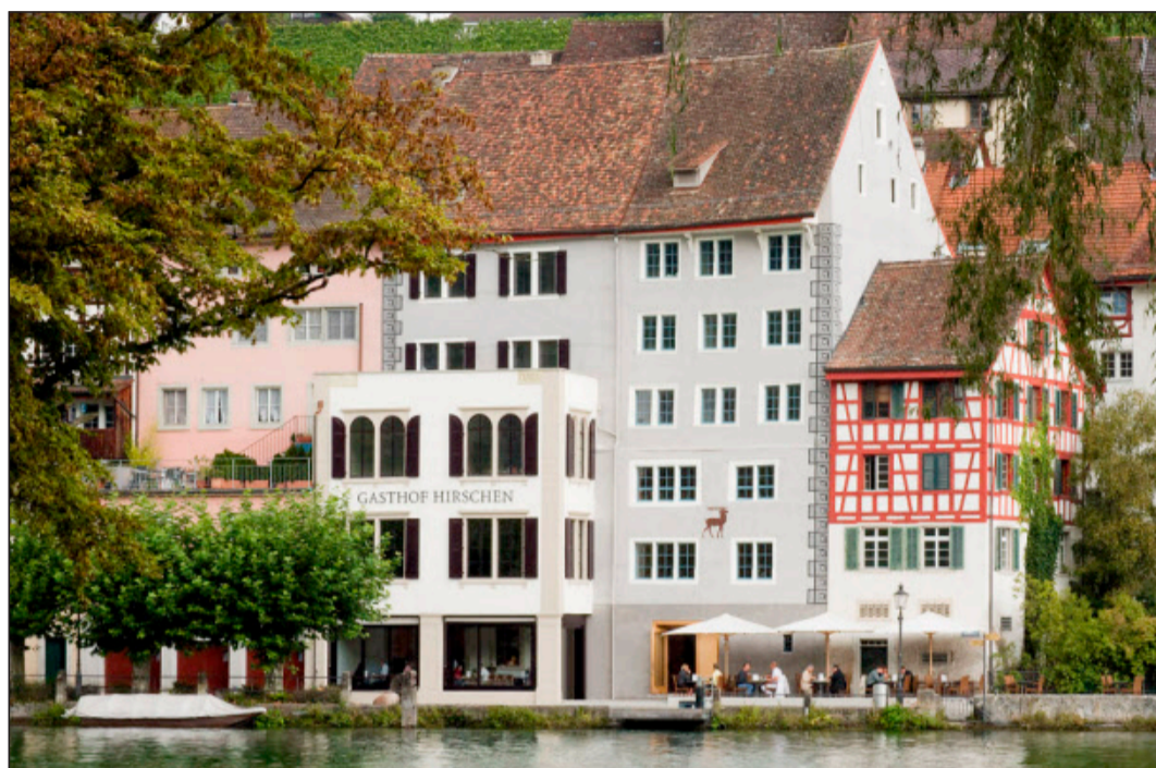
Der Gasthof Hirschen liegt direkt am Rheinufer. Seine Geschichte geht bis ins 16. Jahrhundert zurück.

Die Jury würdigt in ihrer Begründung der Wahl des Titelträgers 2009 «die sorgfältige und fachkundige Konservierung und Restaurierung des historischen Gasthauses. Diese umfasst sowohl die Rückführung zugehöriger Raumausstattungen wie auch die Wiederverwendung historischer Bauteile». Die Einrich-