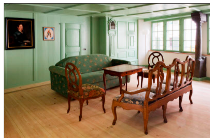
Als «stilsicher und gekonnt» wird die Neumöblierung gewürdigt.

Die Jury Historisches Hotel des Jahres 2009