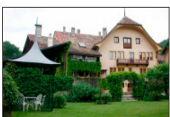
Hôtel Au Lieutenant Baillival.

«Die fachgerechte Restaurierung des vollständig erhaltenen Bestandes qualitätsvoller Hotelmöbel aus allen Epochen des Betriebs» brachte «Stern & Post» Amsteg den Spezialpreis ein. kjv