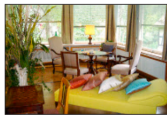
Hotel Stern & Post, Amsteg.